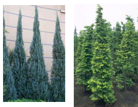
「ブルーヘブン」 ヒノク科常緑針葉