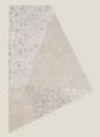
PST3158 ミラージュ キリコ