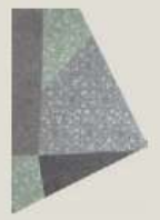
PST3159 ミラージュ キリコ