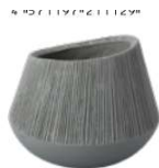
TL012-1LGY エディタウトグレー L 売注単位: 1 ¥30,000 穴開 φ470 × 380mm 高さ 1,020mm